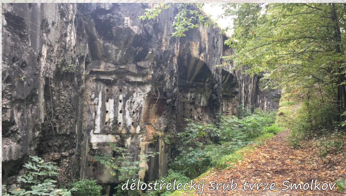
dělostřelecký srub tvrze Smolkov

Asi v polovině okruhu byly keše umístěny u starých vojenských bunkrů, srubů a pevností, takže jsme si jako bonus mohli i dělostřeprolézt okolí těchto objektů.