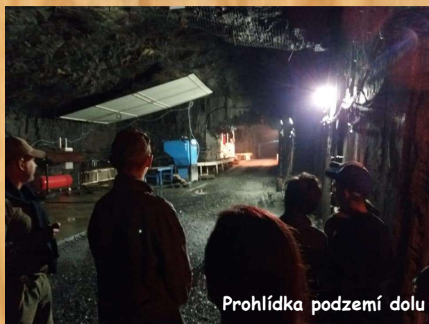
Prohlídka podzemí dolu