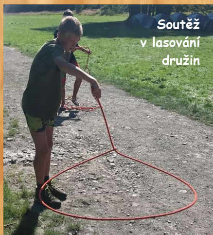
Soutěž v lasování družin

vysílačka, lasování a příroda nám vyplnila všechn čas až do oběda. Na oběd