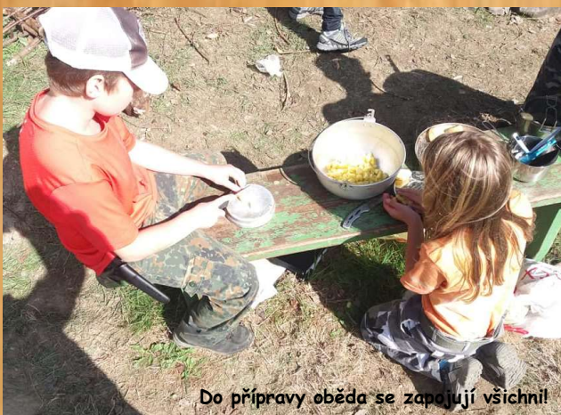
Do přípravy oběda se zapojují všichni!

ohniště plnohodnotná. Naštěstí jsme měli k dispozici přenosné lavičky, takže odpadla ta největší hrůza. Ale alespoň měla každá družina na čem