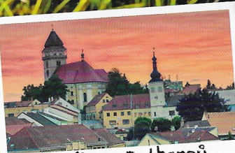
Vítejte u Dalbergů v Dačicích