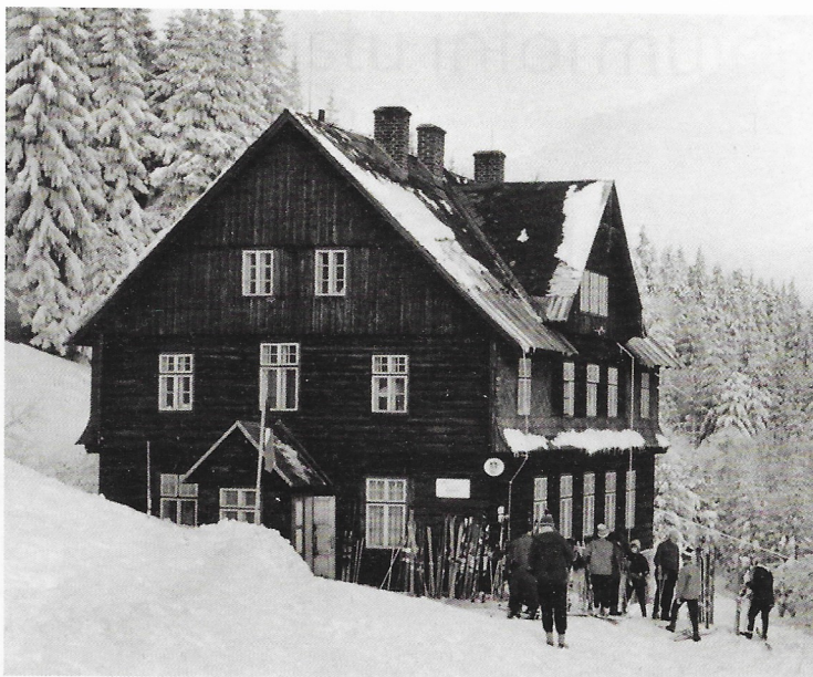
Ilustrační foto chaty Návrší u Králického Sněžníku

Nyní začínáme hledat spolupracovníky, kteří chtějí s budoucí