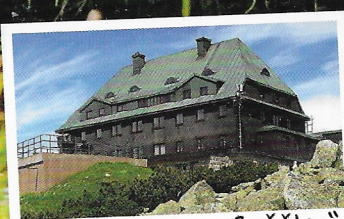
Na Szrenici – „Sněžku“ západních Krkonoš